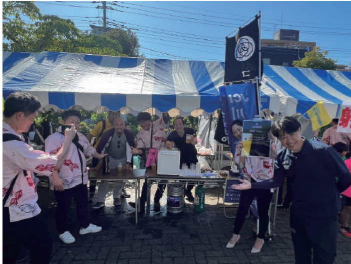
COEDO ビール販売ブース販売の様子