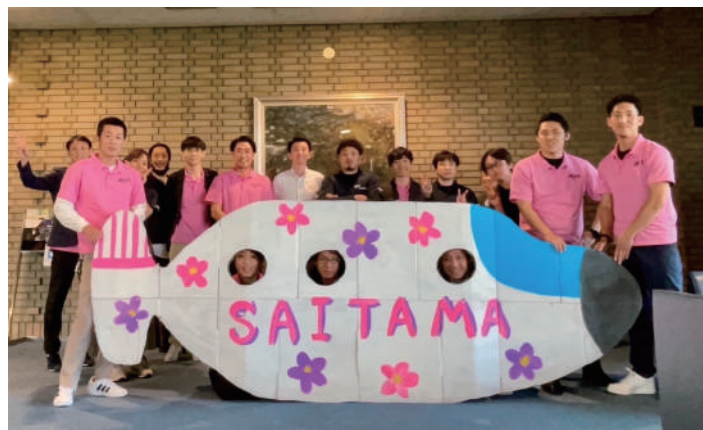
出向メンバー集合写真