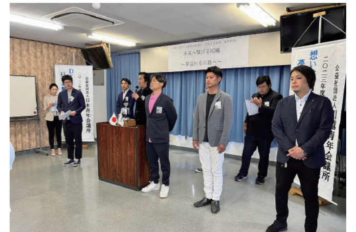
セレモニーの様子