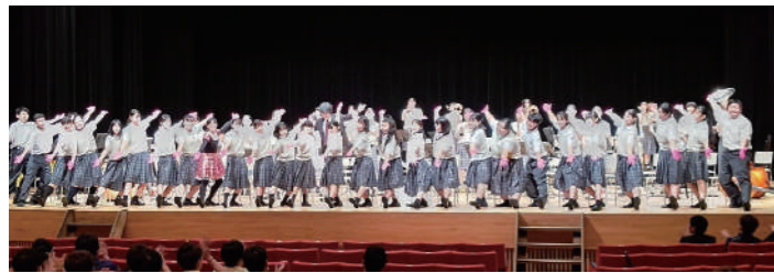
地元高校生によるセレモニーの様子