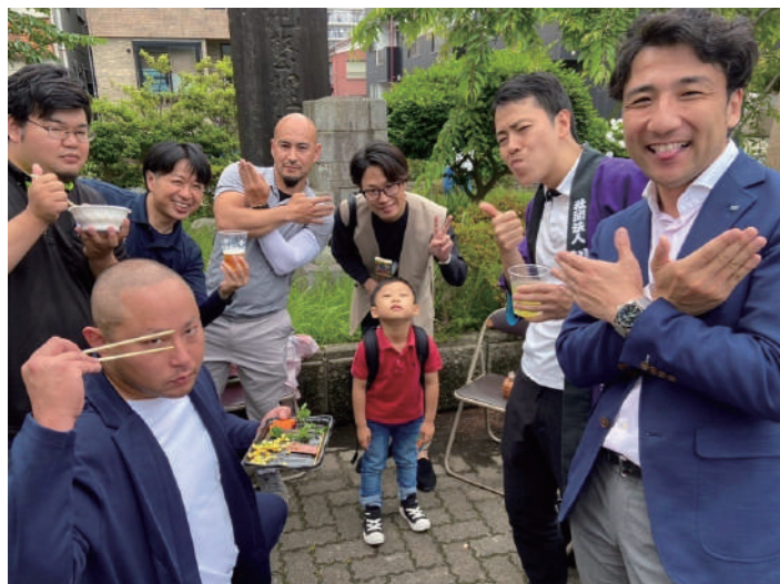
川越から集まったメンバー