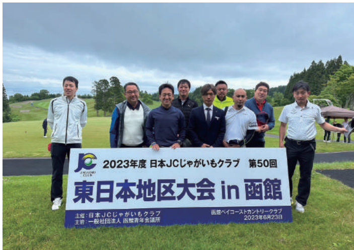
2023年度日本JCじゃがいもクラブ第50回