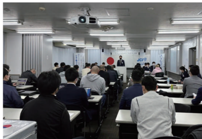
第1回メイン事業全体会議