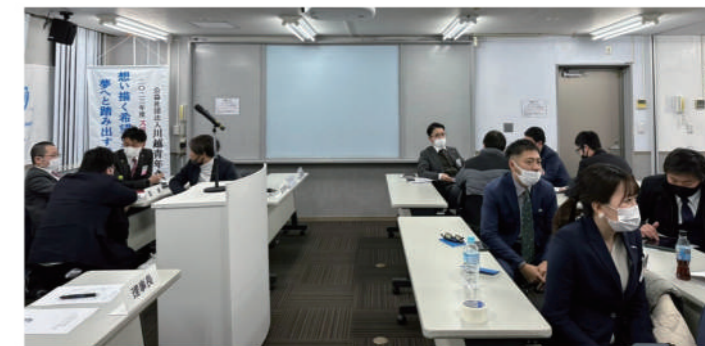
各室ごとに分かれて室会議を開催