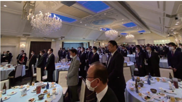
新年懇親会にご参加いただいたご来賓・OB会の皆様方

ご参加いただきました多くのメンバーへこの場をお借りして厚く御礼申し上げます。また、京都会議2023特設サイトより、様々なセミナーが配信されておりますので、是非ご覧ください