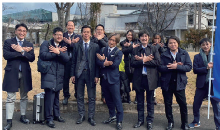
京都国際会館にて現地参加したメンバー