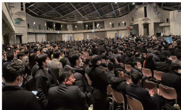
2023年度京都会議の様子