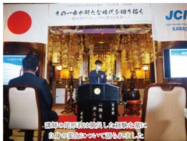
講師の尾形君は被災した経験に基づき自身の変化について語られました