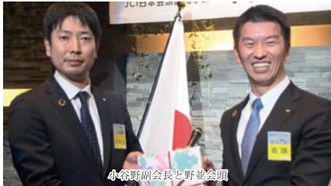
小谷野副会長と野並会頭