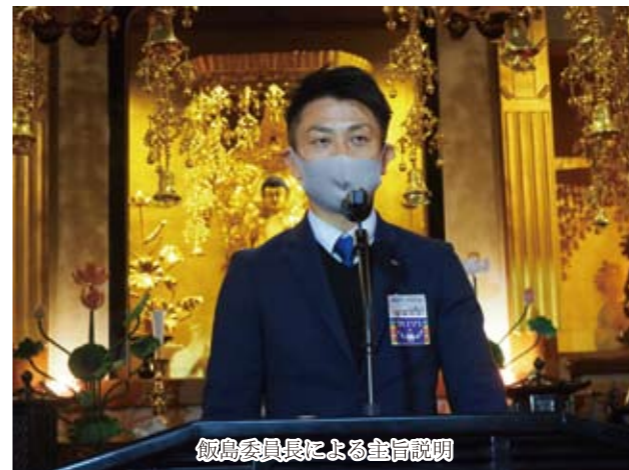
飯島委員長による主旨説明