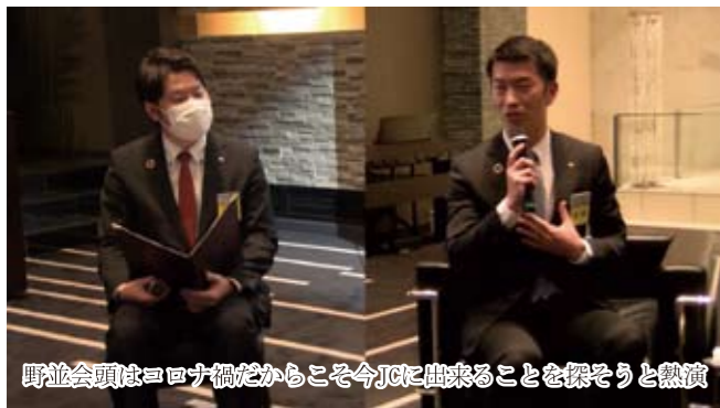
野並会頭はコロナ禍だからこそ今JCに出来ることを探そうと熱演