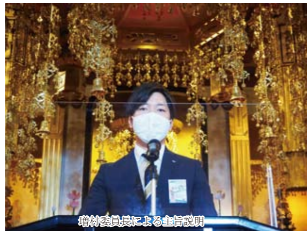
増村委員長による主旨説明